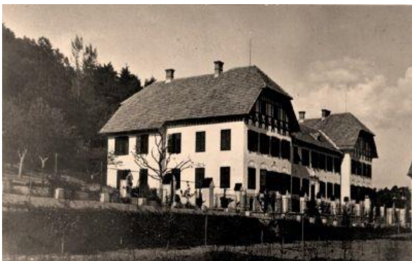
Kmetijska šola ob ustanovitvi leta 1910