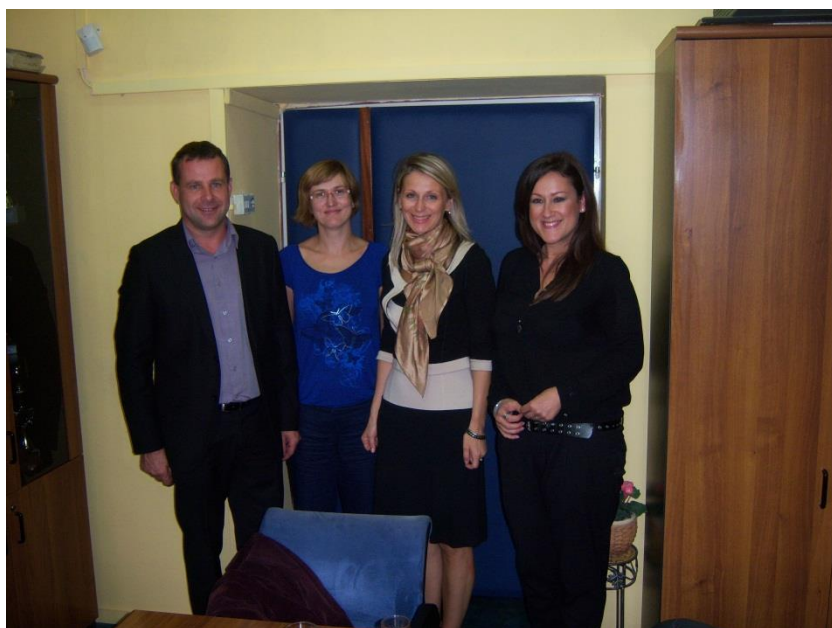
Erasmus koordinatorica šole gostiteljice in sodelavci iz Šentjurja.