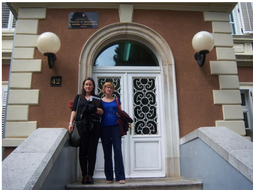
Sodelavki s SŠ Šentjur pred stavbo šole gostiteljice.

Utrinki z mobilnosti zaposlenih v septembru 2013 na Fakulteti za management v turizmu in gostinstvu Opatija